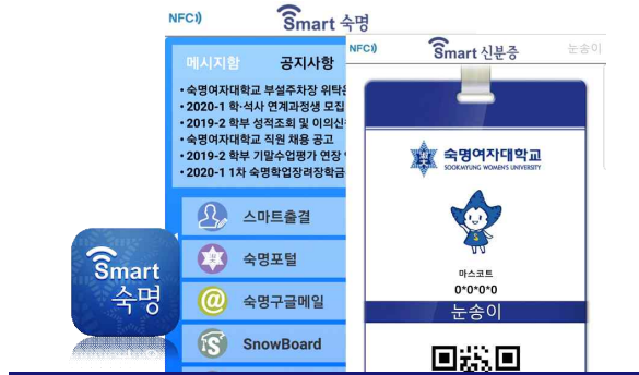
스마트 속명(APP) 속명 모바일 서비스 종합 어플리케이션