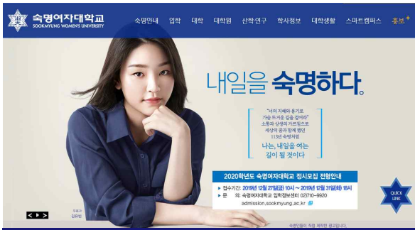
학교 홈페이지 학사 전반에 대한 정보를 제공하는 곳