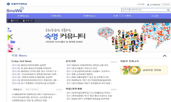
SnoWe(커뮤니티) 각종 공지사항을 확인할 수 있는 곳