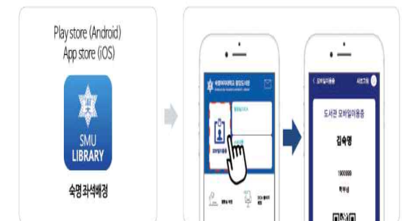
속명좌석배정(APP) 속명 도서관 서비스 종합 어플리케이션